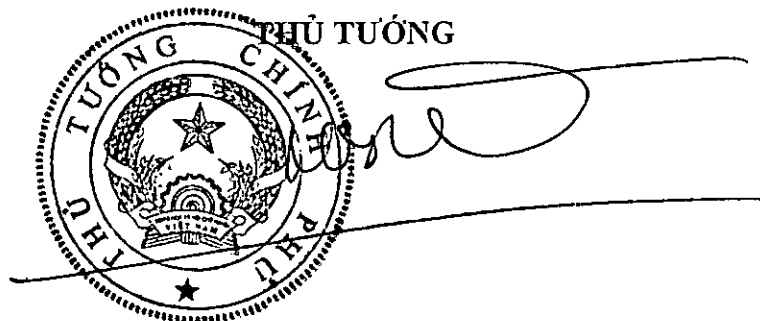
Phạm Minh Chính